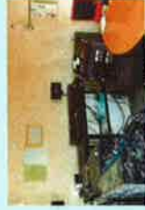
スタジオ専用編集ルーム