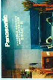
Panasonic・NSE共同開発・水中スピーカー