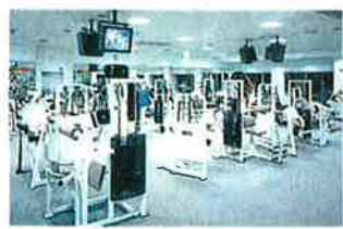
NSEでは音響システムの他に、ジム内に設置するモニターなど、ビジュアル機器のプロデュースも行っています (スポーツクラブ。ルネサンス港南台)