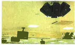
手前が天井から下げるクラスタースピーカー。奥がフロントスピーカー。

特殊照明の制御および定額料金を行うための制御装置。キーボード付きで手軽に移動できます。