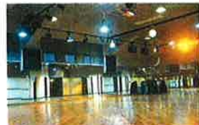
NSEが音響システムを手掛けたスタジオ。そのスタジオにも最適な音響環境に整えられています。(アクア館見)

プールにありがちな雑音を低減してくれるスピーカー。ポリエチレン製で錆の心配がありません。