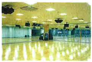
同じくNSEが手掛けたスポーツクラブ。フィットネスジム。同じくNSEが音響システムを手掛けたスタジオ。そのスタジオにも最適な音響環境に整えられています。(アクア館見)