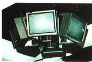
モニターはクラブの要望に応じてラックに入れて壁に、または天井に設置することもできます。(写真上、右: クリスタルスポーツクラブ。写真下: レヴァン宮崎台)