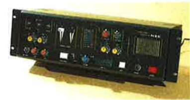
オートミキサー [EVOLUTION3] スポーツクラブでの使用を考えた開発された、エアロビクス専用ミキサー。スイッチを押すだけで2種類の音楽ソースを自動的にクロスカットでき、さらに、カセットデッキのスタート、ストップも自動でできます。また、モニター用のスピーカーがついているので演出も簡単。足元で操作できるフットスイッチもあり、インストラクターの片手となる完成度の高いマシンです。さらに改良をかき入れたバージョン4も12月に発売予定です。

げられます。ワンタッチで2つの音楽ソースを自動的にフェードイン、アウトできるなど、多機能なのに操作が簡単。インストールボックスの声を反映させたエアロビクス専用ミキサーだから、その実現できた操作性の高さが、耐久性とともに「エウォリューション」に絶大な信頼を寄せているのです。 フルサイドこそ実感できる音の良さ 湿気が特に心配されるのが、プールでの音響システム。湿気だけでなく、プールではエコーがかかるか？ それは専門家の腕にかかっています。今年7月13日、横浜市内でアクアエクササイズの研究施設「アクアダイナミックス研究所」(企画・運営)が行われましたが、参加した方の中には、プールサイドにもかかわらず、音の良さに驚いた方も多かったのではないのでしょうか。実はこれこそNSEが協力をし、最適な音響環境を作り出した結果なのです。 また、NSEは音響環境だけでなく、モニターなどのビジュアルも含めたトータルプロデュースも行っています。また、装飾性にもこだわり、クラブの美観を損ねないような機器の形、配置にも工夫をこらしています。 何げなく耳にしている音ひとつにも、これだけの情熱が込められているのです。そう思うとフィットネスクラブで聴く音楽が違って聞こえてくるかもしれません。