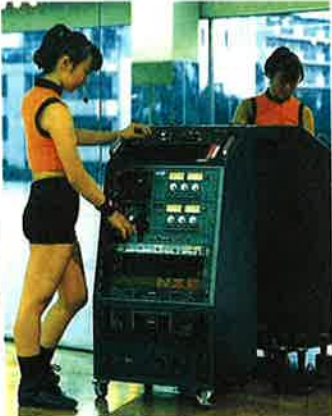
音響システムラック [WK-12CN] エアロビクス専用の超小型オリジナル音響システムラック。この中にレッスンに必要な音響システムをセットできます。インストールボックスの身のこなしも軽いため、エレコンボックスに基づいた使いやすい動きも特徴です。また、エレコンボックスが搭載されているので移動にも便利。オートミキサー [EVOLUTION3] (ラック上置) のほか、デッキ、イコライザー、アンプなどが組み合わされます。