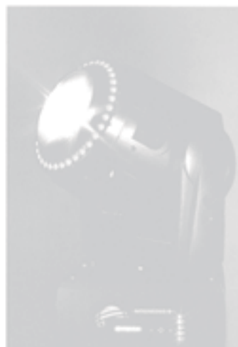
↑サイズは幅500mm、長さ630mm、高さ950mm、重量は50kg

本体内部にはCMY（C=Cyan:青、M=Magenta:赤、Y=Yellow:黄）のガラスフィルターが搭載され、ガラスを重ね合わせることで多彩なカラーエフェクトも可能。価格は参考価格で540万円。