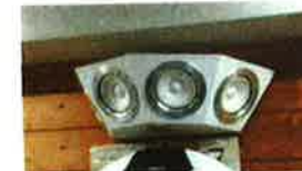
フルサイズのラッピングスピーカー