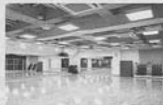
【スポーツバ アスリーエー江】

「NSEのスピーカーは音質のよさに加えて、音をスタジオ全面に均等に響き渡らせる耳への快適性・安全性。さらにはデザイン的な雰囲気や地震時の安全性等から選びました。全店で導入しています。」