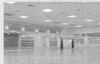
【アイレックススポーツクラブ グランド】

フィットネスクラブに特化した音響設計・設備機器メーカーNSEの誇るラッピングサウンドシステム(特許取得)は、今までのスピーカの概念を覆す良質な音を提供できます。空間全体に均等に波動のように快適に響き渡ります。インストラクターはもちろん、大切なお客さまの耳に優しい音を届けることができます。スタジオバージョンのみならず、アクアバージョンの「アクアサウンドシステム(防滴仕様のコントローラー付)」も完成しています。一度ぜひお聞きください。違いはすぐに分かります。