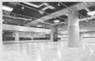
【ジェクサー・フィットネス&スパ(上野)】

「当社は安心・安全という観点から会員さまにもインストラクターにも優しいラッピングサウンドシステムを採用しました。また、音楽と運動したライティングシステムはスタジオを特別な空間に変えてくれます。」